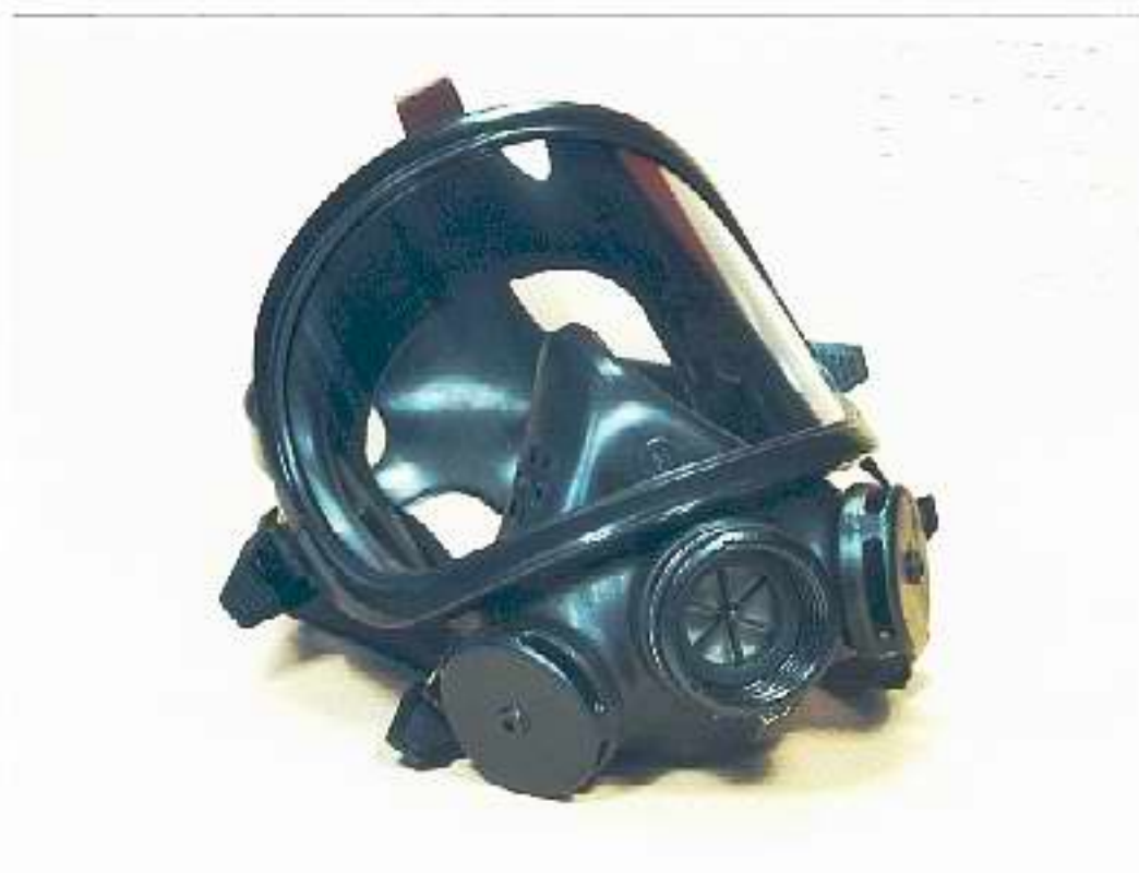
Photographie de l'équipement