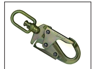
IKV 33 (ANSI Z.359.1-2007; CSA Z259.12-2011) mit Fallanzeiger